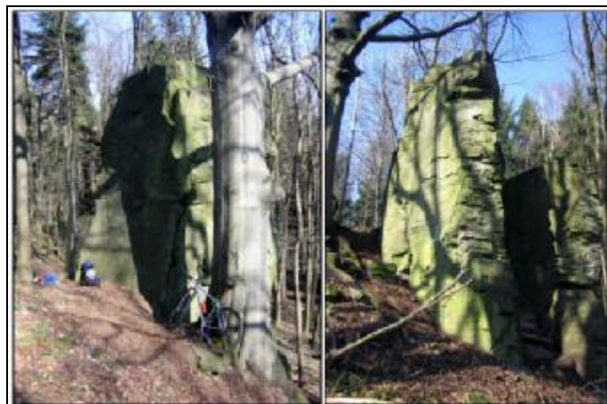
O Havraní věži Vláďa trochu škodolibě dodal: „A ještě jedna zajímavost z geodetického soudku. Hranice okresů prochází právě Havraní věží, pravá nižší půlka věže leží v okrese Děčín a vyšší v okrese Česká Lípa. To jsme to těm Děčínákům zase pěkně nandalí!“

A samozřejmě zde napáchal se spolulezci plno pěkných cest. Věž je z neobyčejně kompaktního čediče (nebo znělce?) s malými pozitivními lištami, příjemnými na dotek. Cesty jsou dobře odjištěné a kluci plánují i umístění vrcholové knížky, která zatím chybí.