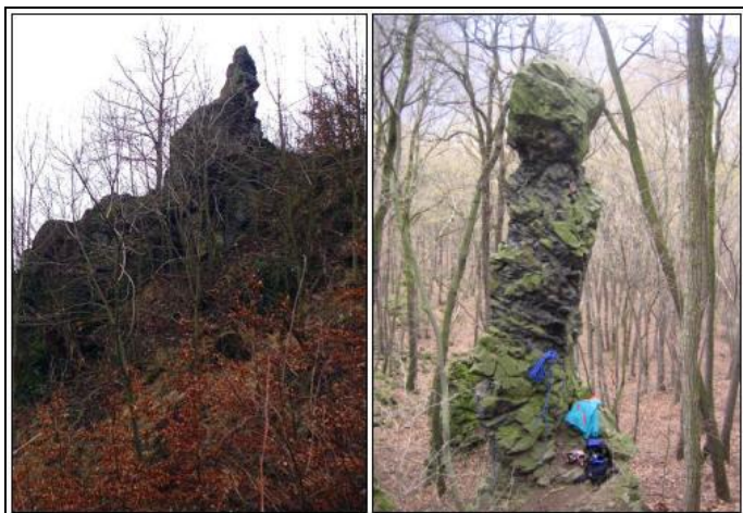
Vlevo Židův Strážce Zubrníc , vpravo neodolatelná Vyžvejklá bambule s cestou Pozitivní deviace..