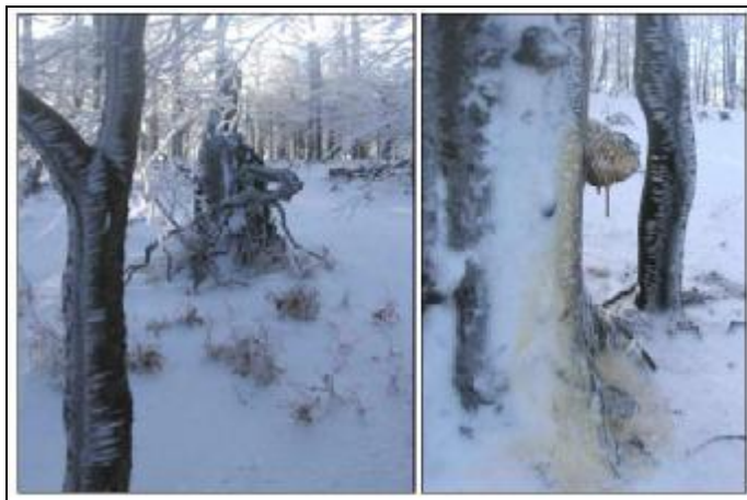
Strašidelný les na Velkém Buku