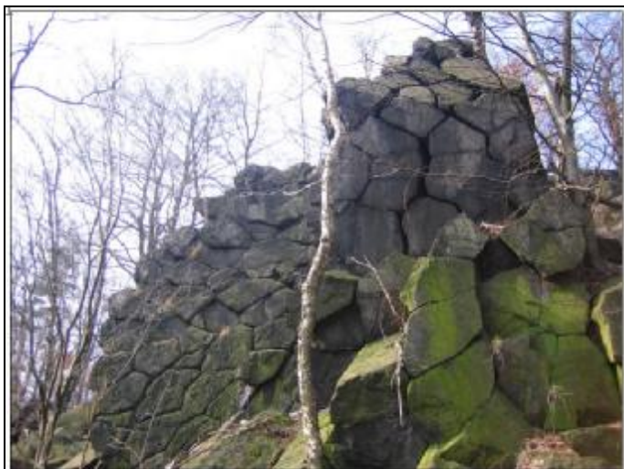
La Scala poskládaná z mohutných kvádrů, které zrovna dvakrát neberou, i když na pohled to vypadá přesně naopak..

Tahle zajímavá, zatím neodtajněná, skála na vás vyskočí, když pojedete na kole z Chlumu po červené značce na Vrabinec a budete mít oči otevřené. Zatím jediná cesta vede středem hlavní mozaikové stěny a jmenuje se Fidelio..