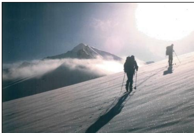
Cestou na Großer Geiger, v pozadí Großvenediger

Ještě zpět k závodnímu skialpinismu: pikantní je postřeh, že existují závodníci ve skialpinismu (v českých horách se