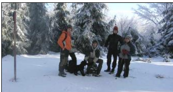
Zde jsem přišla o svačtinu. Budu muset dojít až do nejbližší hospody..