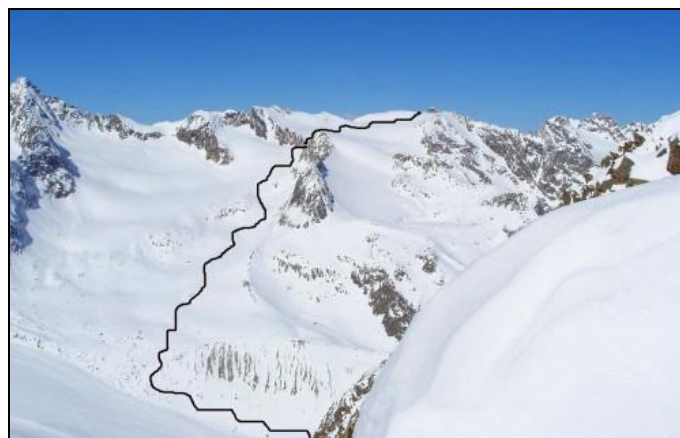
Wildes Hinterberg (3288 m) ve Stubaiských Alpách je ukázkou túry klasifikace I až II (v pětistupňové klasifikaci). Trasa výstupu i sjezdu je totožná.

Volbu vhodné túry je nejlépe provést dle skitouringového („skialpového“?) průvodce. Průvodce obsahuje obvykle panoramatickou fotografii, dle které se dá posoudit charakter túry a získat základní orientaci, popis výstupu i sjezdu s upozorněním na problémy (vhodný čas, lavinové nebezpečí, trhliny v ledovci apod.) a schematickou mapku. Dále podrobný popis příjezdu do východiska túry (kde parkovat) příp. výchozí či podpůrnou chatu. Často podrobné údaje o chatě (kapacita, provozní období, existence zimního útulku, telefon na chatu či na správce v údolí, popis jak chatu najdeme). A hlavně klasifikaci cesty, často ve stupnici, která je přímo definována jen pro účely daného průvodce. K průvodci je dobré si opatřit podrobnou mapu horské oblasti 1:25000 příp. hůře 1:50000 s vyznačením lyžařských túr a zimních cest. Doporučení konkrétní mapy bývá rovněž v průvodci (č. mapy a nakladatelství).