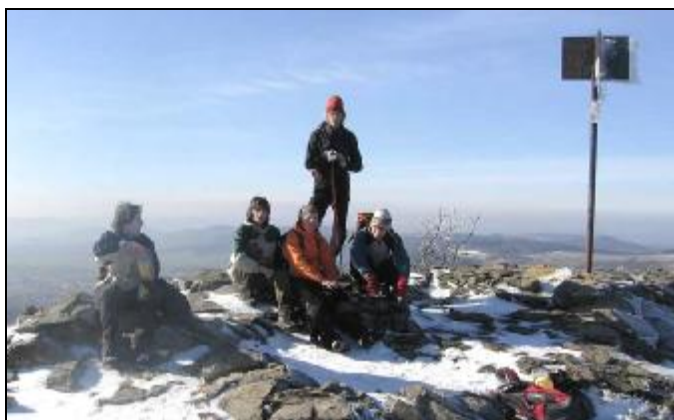
Na vrcholu Klíče - tak už jen pro tyhle pohledy se to vyplatilo..

Další vrchol je perla – výstup na Klíč (759 m). Je nádherně, potkáváme spoustu vysmátých ceprů, no my působíme trochu zdrchaně. Na Klíči v 10:55, výhled úžasný – jsou vidět Krkonoše, Sněžka a taky úplně v dálce Studenec, který nás ještě čeká. Radši o tom nepřemýšlíme..