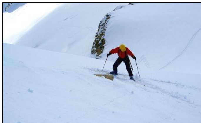
Obrátka při stoupání v prudkém svahu a vrstvě prašanu dá zabrat.

Proč provádím tento historický exkurs? Chtěl bych se pokusit buď demýtizovat termín skialpinismus s tím, že může existovat i v neextrémní či volitelně extrémní formě tak jako horolezectví, nebo že bychom měli možná používat i jinou terminologii, či si alespoň uvědomit, že existuje, jak již výše zmíněno.