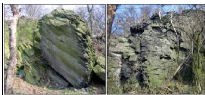
Kančí stěny – vlevo Jupiter, vpravo jeden z masivu.

Leží mezi Velkou Velení a Lesnou v zarostlém svahu mezi pastvinami. Lezecky byla zatím zprovozněna pouze hladká stěnka, kde je několik většinou těžších boulderů až do 7B+. Ostatní masivy čekají na dobrovolné quakery, kteří by je vytrhli ze spárů šípkových keřů a očistili od neposedných lokrů.