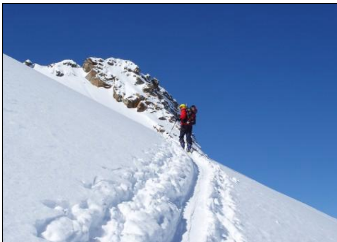
Čím modřejší je nebe, tím hlubší je můj dech..

Chaty jsou situovány zpravidla v závěru horských údolí ve značných nadmořských výškách. Pro přesun od auta na chatu je potřeba počítat většinou celý půlden.