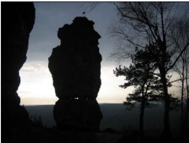
Silueta Sokolí věže v Rájci v jarním podvečeru..

Květnové CNS by mělo už vyjít jak se patří – tak jen nejčerstvější novinku (a SUPERBOMBU) – Ondřej Beneš přelezl 1.5.2007 cestu Papírový měsíc XIIa! Gratulujeme!!