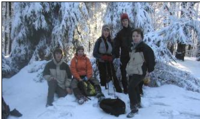
Na vrcholu Bouřného (703 m n.m.) se nám prvně ukázalo sluníčko

Mám krizi, dlouhá cesta po silnici mi nedělá dobře, zima, šedo, jak se říká, nejtemnější chvíle přichází před úsvitem. Začíná mě bolet koleno a mám chuť celou akci vzdát. No a najednou v 5:09 Hvozd (749 m). Stejnou cestou zpátky, a když už mám tu štreku po silnici za sebou, říkám si, zkus ještě další. Cestou svítá a my dorážíme v 8:00 na Bouřný (703 m).