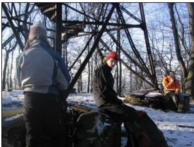
Vrcholové foto na Studenci (736,5 m) jako vzpomínka na pěknou akci..

Devět vrcholů za sebou, čeká nás bonbónek – Jedlová hora (774 m). Shadow má dost, při každém zastavení si lehne a nechce se mu dál. Všichni toho máme plný brejle, stmívá se a vysílač na Jedlové hoře mrká červeným světýlkem, láká, jenže se moc nepřibližuje. Výstup zvládáme už jen silou vůle, v 19:55 se kácíme ve vrcholové restauraci na lavice, Shadow pod lavici. Místní si myslí, že jsme cvoci, nedivím se. Trochu se zmátoříme a jdeme na sestup, po sjezdovce. Některé úseky absolvuju pozadu, už mě tak bolí koleno, že se jinak nedá. V Jiřetíně nás čeká odvoz do Varnsdorfu..