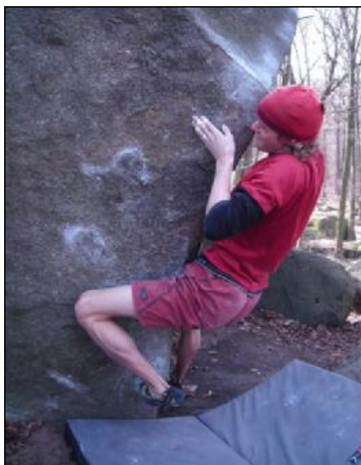
Jesenicko, oblast Pod hradem, sektor Trio..

V příštím čísle CAO News vyjde moc pěkný článek o boulderingu od Honzý Horáka . Lezení po nejrůznějších balvanech jen s lezačkami a pytlíkem magnézia se věnuje stále více lezců a někteří mu již zcela propadli. Tahle zábava, která na pohled vypadá možná jednoduše, je v reálu tvrdým sportem se vším, co k tomu patří. Abychom vás naladili, zatím alespoň jedna fotografie z Petrohradu: