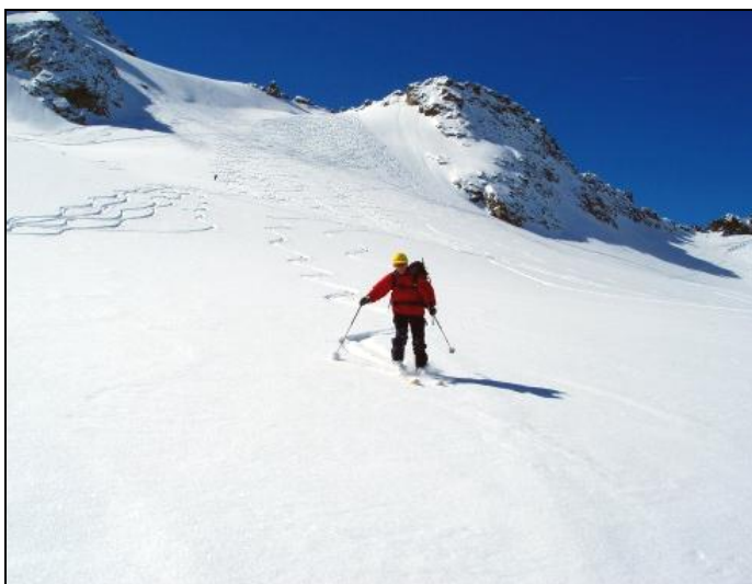
Není nad rozkoš z obloučků v prašanu..

Lyžařské průvodce jsou k dostání přes internetové obchody různých horských nakladatelství (Bruckmann, Rother, Schall, Freytag&Berndt a další). Doporučuji nekupovat podrobné průvodce oblastí, ale výběry nejkrásnějších túr pro celé rozsáhlé alpské oblasti. Jistě se necháme upoutat názvy jako Schitouren erlebnisse, Genuss-schitouren atlas, Traüme in Pulver und Firn nebo Schitourenparadies.