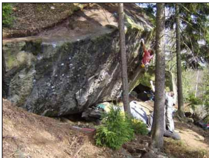
Známary boulderový guru Jarda Ježek v cestě za 7B+ v zatím utajované nové boulderové oblasti...

Upozornění: E-mailova registrace je nutná kvůli omezenému počtu trik a průvodců!