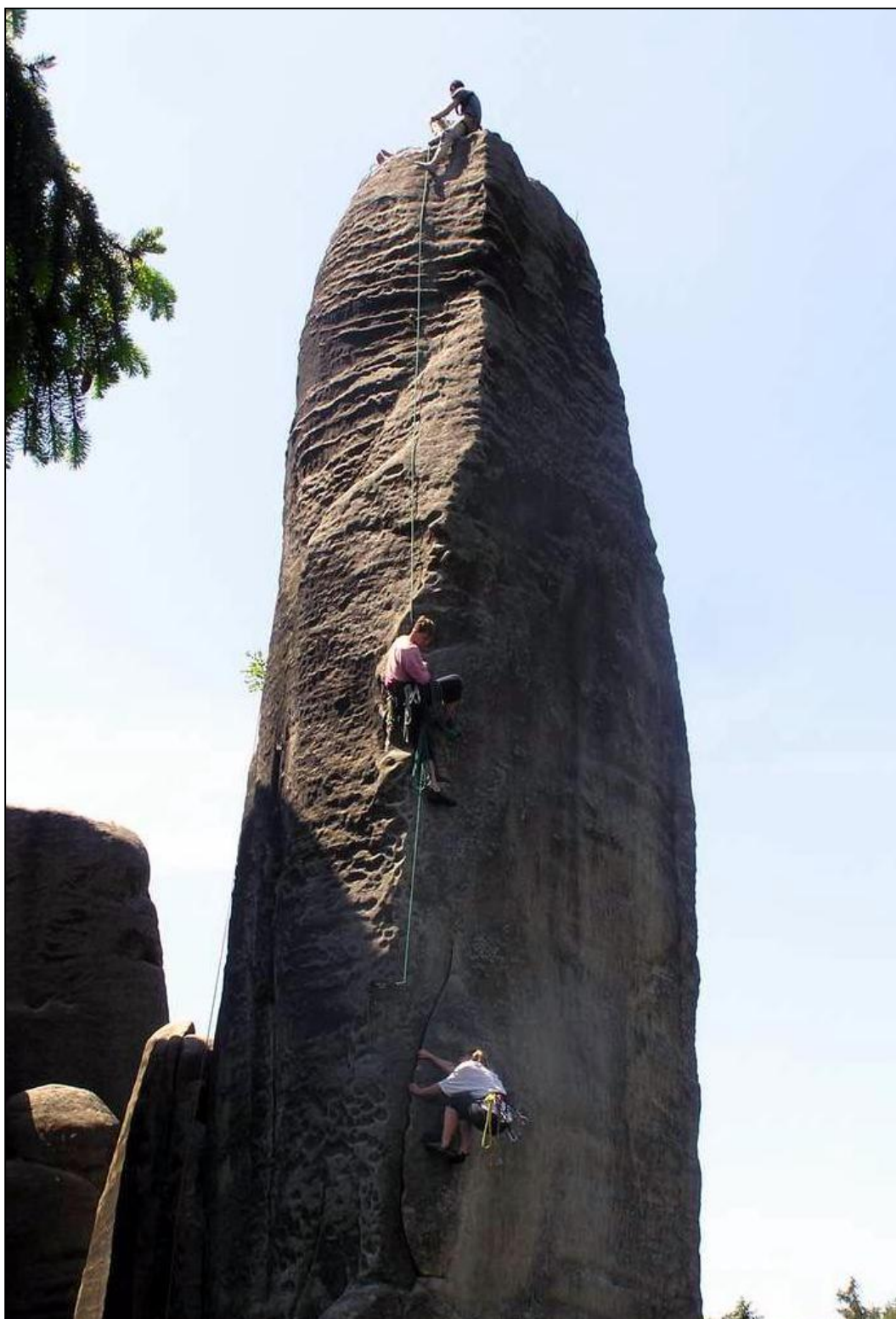
Adršpach, Hrana pádů VIIIb.